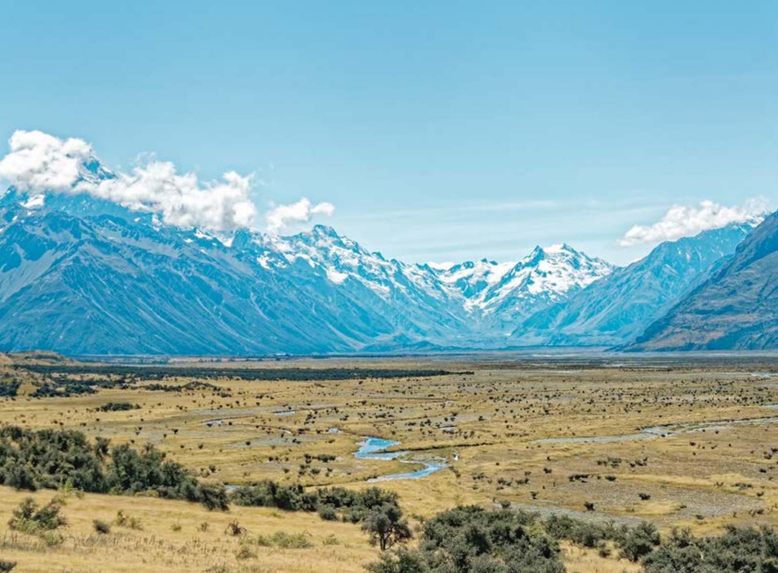
Der verzweigte Tasman River fließt aus den Südalpen; rechts der Mt. Cook (höchster Berg Neuseelands).